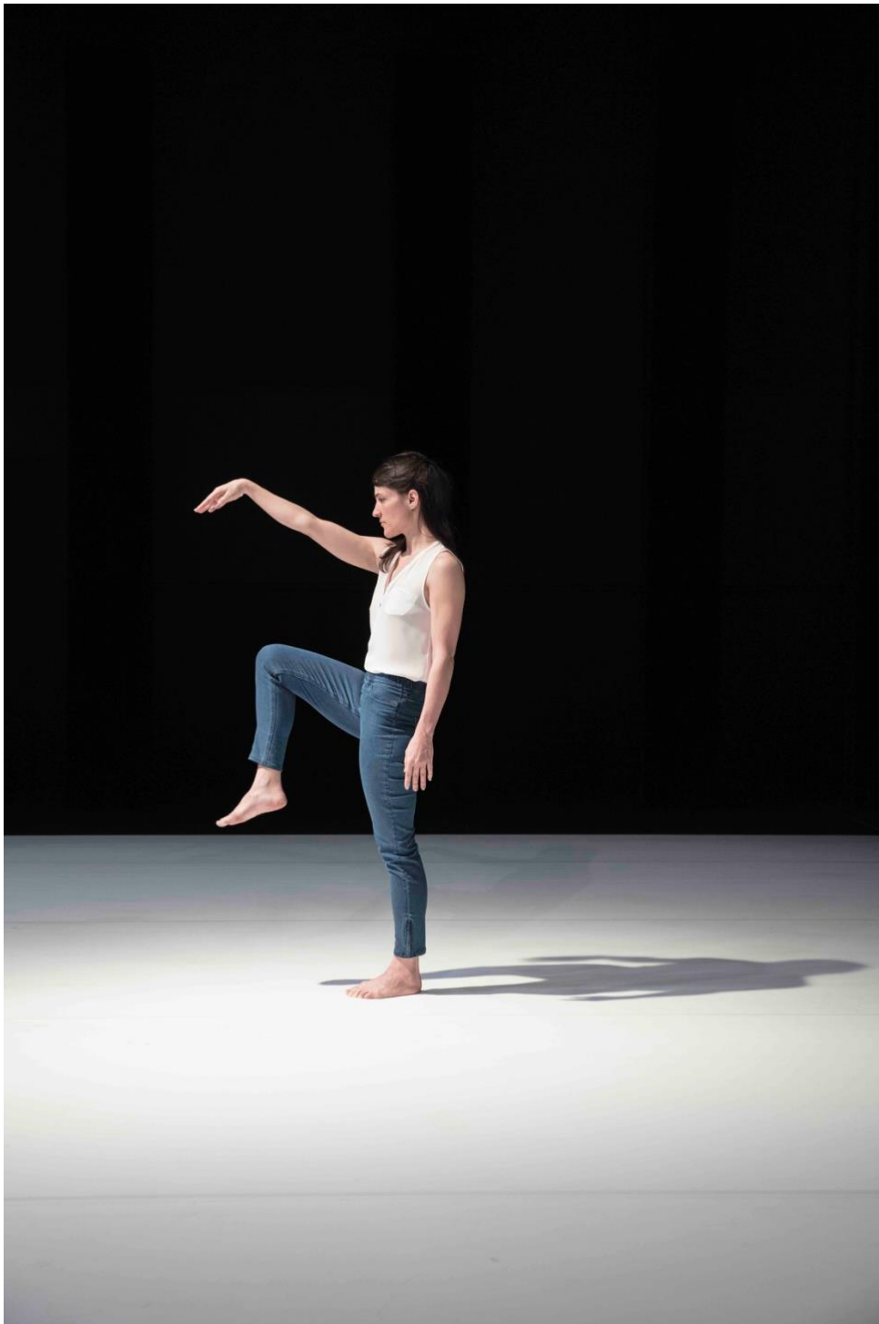
« Se Sentir Vivant » de Yasmine Hugonnet, 2017

ARSENIC / Festival Programme Commun – Lausanne (CH)