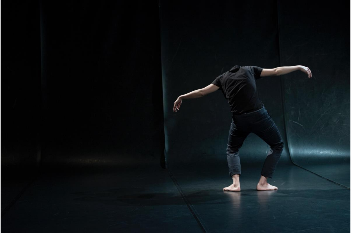
LE RECITAL DES POSTURES (2014) – solo – 50 min