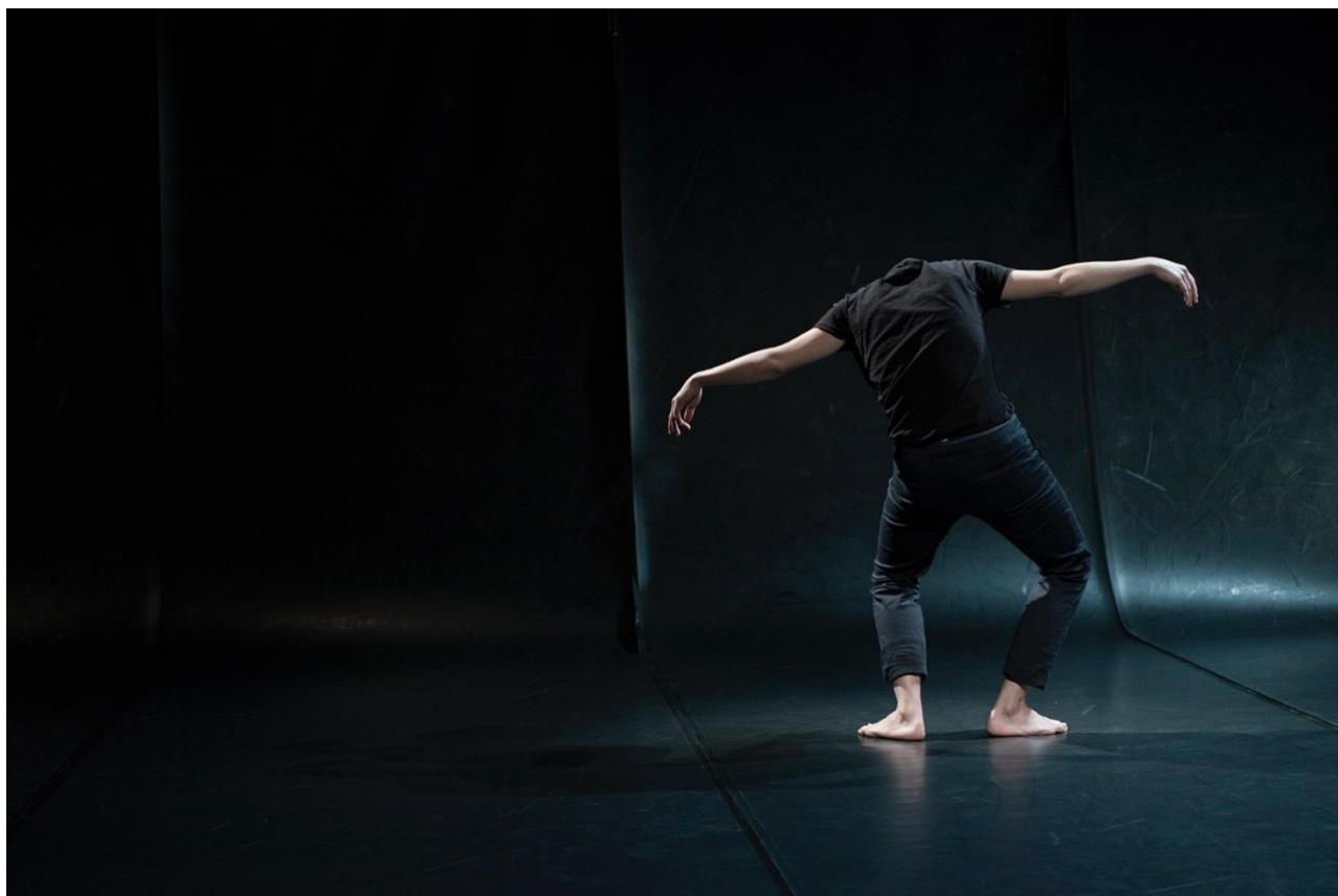
LE RECITAL DES POSTURES (2014) – solo – 50 min